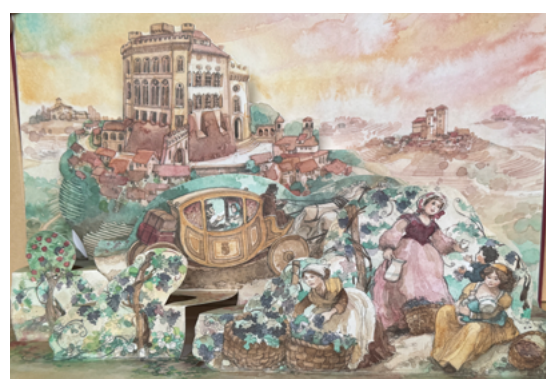
Fig. 1 a, b, c. | Barolo. Alchimia di una storia d'amore / Alchemy of a love story. Copertina e due tavole interne.