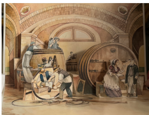
Fig. 4. || La quinta tavola relativa a Barolo, non compresa nel libro.