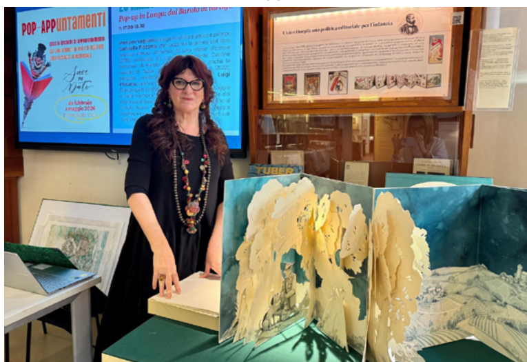
Fig. 8. || Il pop-up di grandi dimensioni esposto al Pop-App Museum in occasione dell'incontro.