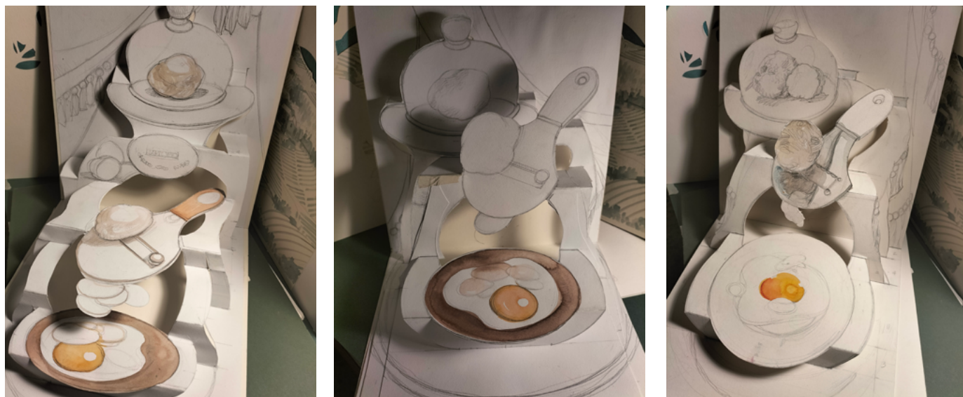
Fig. 7 a, b, c. || Tuber Pop-up . Tavole di progetto, particolari.