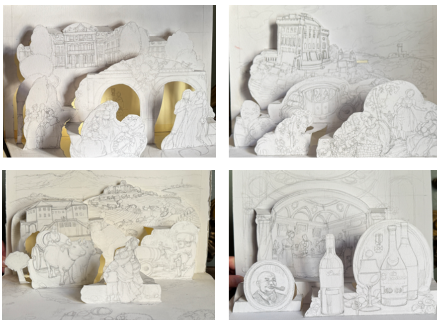
Fig. 5 a, b, c, d. || Barolo. Alchimia di una storia d'amore / Alchemy of a love story. Tavole di progetto.

Con Tuber Pop-up – Tuber Comics , invece, mi sono confrontata con il mondo del tartufo, con il suo carattere nascosto, quasi segreto. Anche in questo caso ho lavorato per evocare più che per descrivere, lasciando che la carta costruisse piccoli ambienti da esplorare (Fig. 6 a, b; Fig. 7 a, b, c).