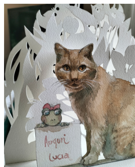
Fig. 3. | Biglietto pop-up realizzato a mano, particolare.

Nel progetto dedicato ai Marchesi di Barolo ho cercato di tradurre in forma tridimensionale l'identità delle Langhe, la storia del vino, le architetture e il paesaggio. Mi interessava che ogni apertura del libro fosse una scoperta, un'esperienza visiva capace di restituire non solo un'immagine,