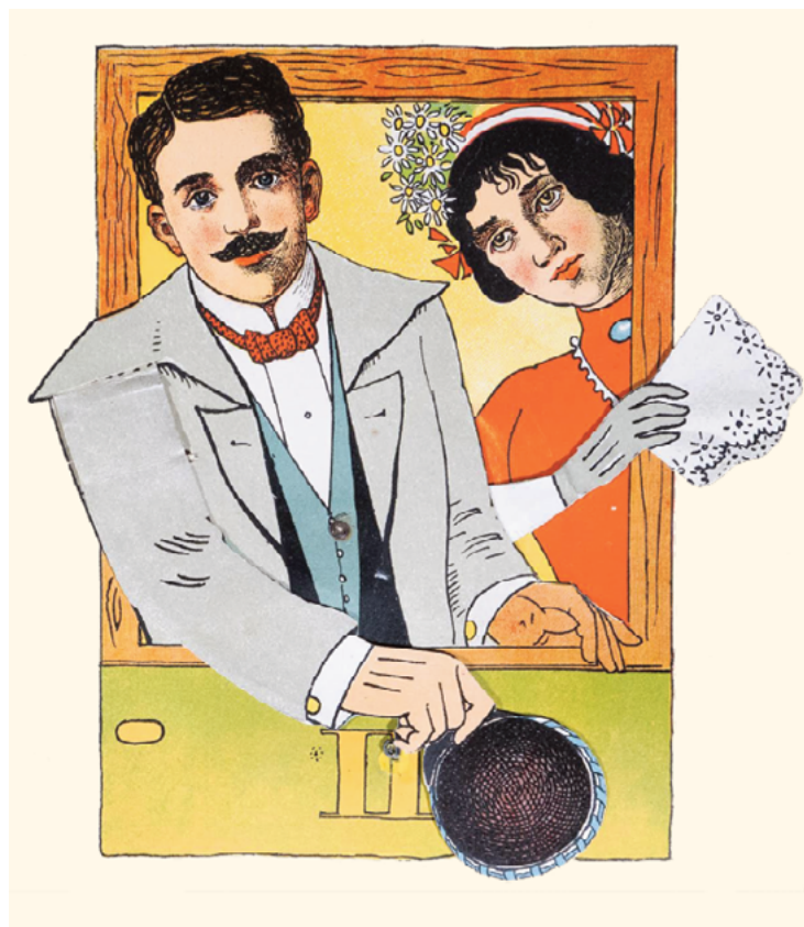
Image taken from the plate n. 8 di Pupazzi vivi e allegri (Milano, 1911).